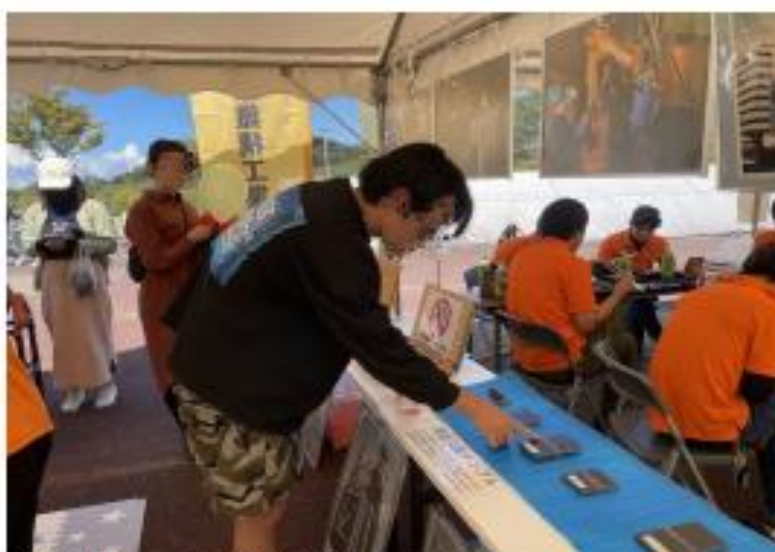
溶接欠陥サンプルを見る保護者様