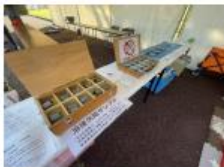
サンプル展示状況